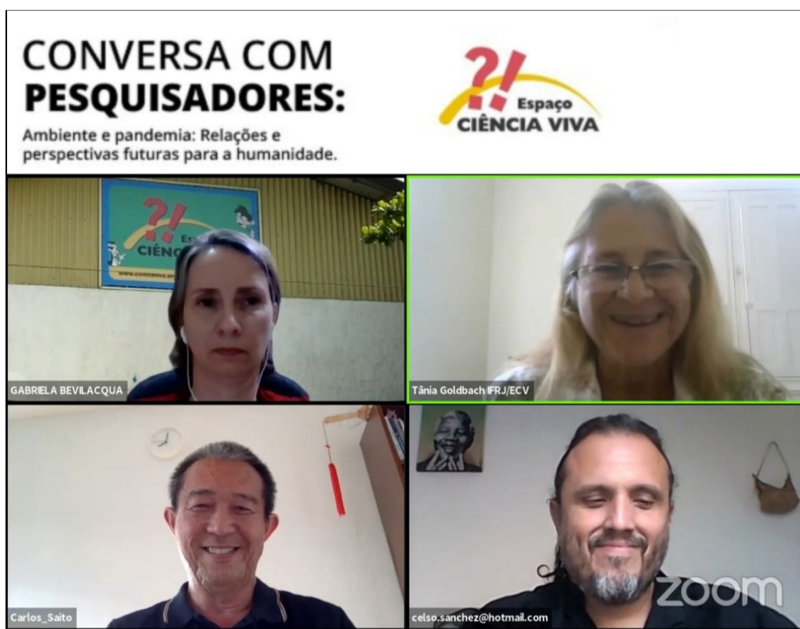
Foto: Tela impressa do encontro via Youtube. Julho, 2020

Para quem não acompanhou, o debate está disponível no canal Espaço Ciência Viva ECV .