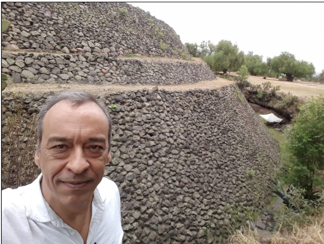
Pirâmide urbana na Cidade do México. Junho, 2019

Saiba mais sobre a parceria: saulofilhocds@gmail.com