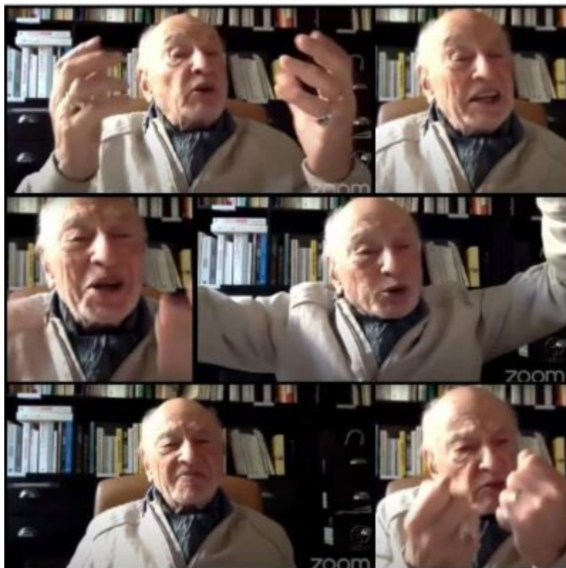
Mosaico de imagens do evento 2020.