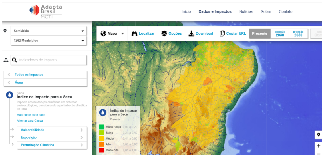
Imagem ilustrativa da plataforma. Dezembro, 2020.