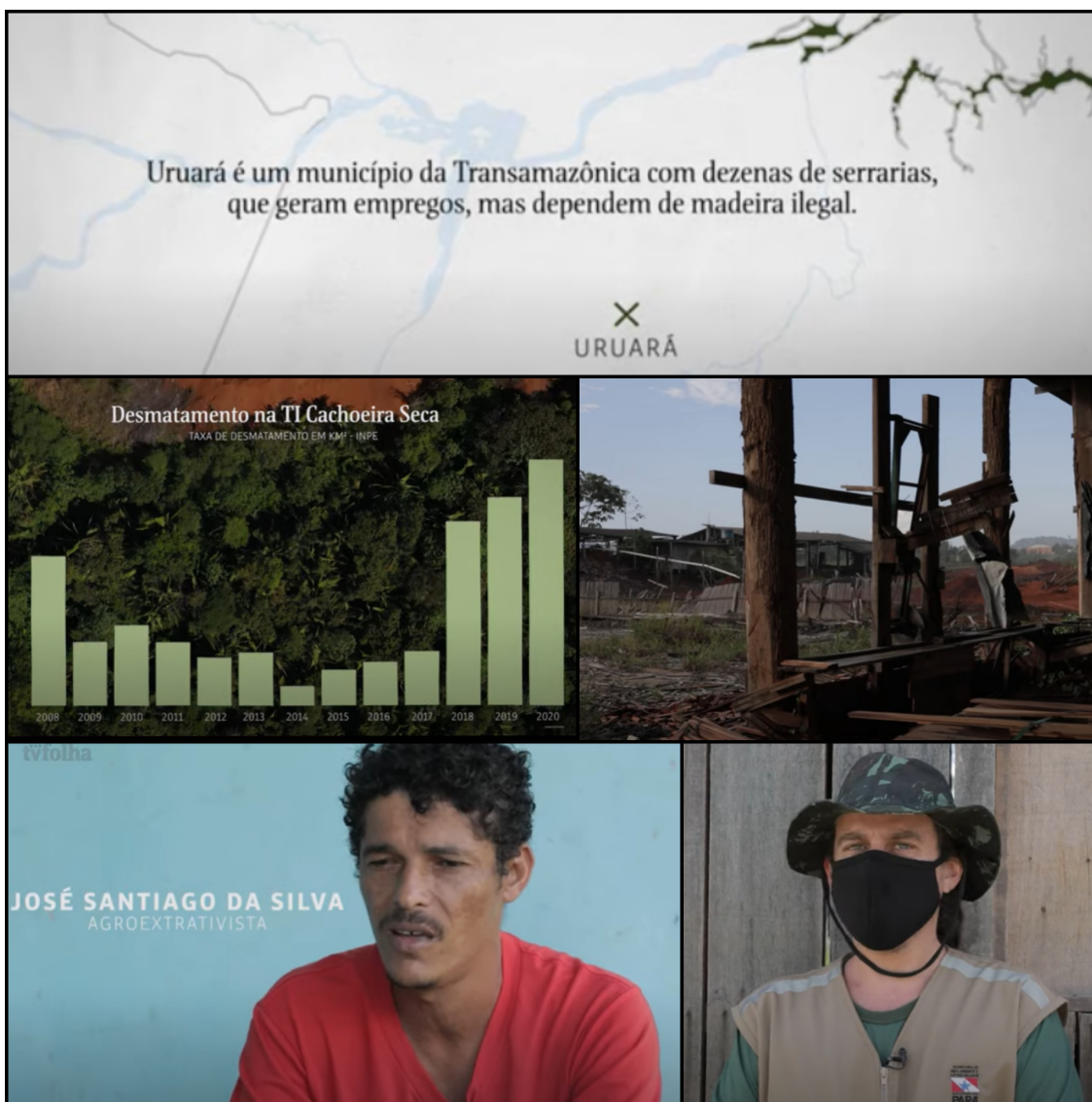
Mosaico de imagens do documentário. Dezembro, 2020.

Assista ao documentário no canal TV FOLHA .