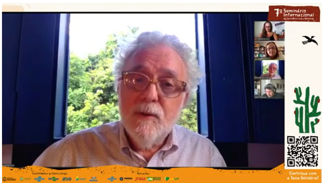
Captura de tela do evento. Dezembro, 2020

Para quem não acompanhou, a palestra está disponível no canal IABSTV .