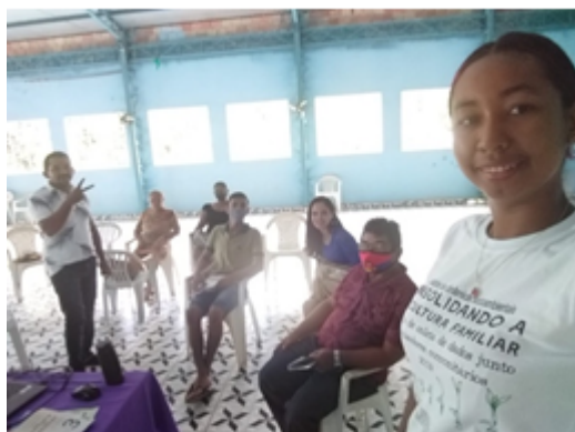
Pesquisadores comunitários reunidos na sede do STTR de Belterra. Eles aplicaram 544 questionários em 62 comunidades.

Após um rico debate, iniciamos um planejamento coletivo para usar os dados coletados em ações estratégicas junto aos tomadores de decisão, na perspectiva de, cada vez mais, fortalecer a agricultura familiar no Planalto Santareno.