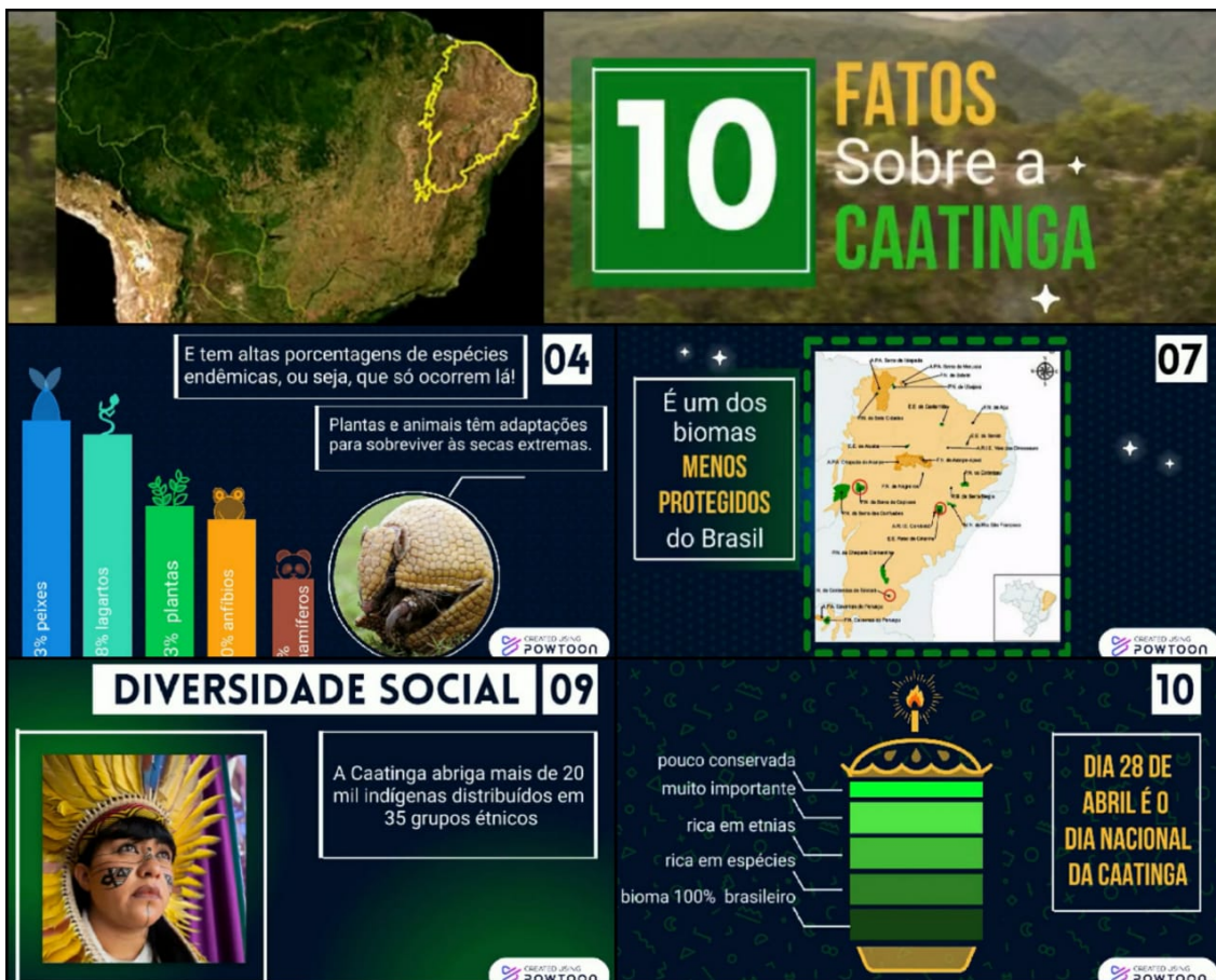
Mosaico de imagens do vídeo "10 fatos sobre a Caatinga". Maio, 2021.