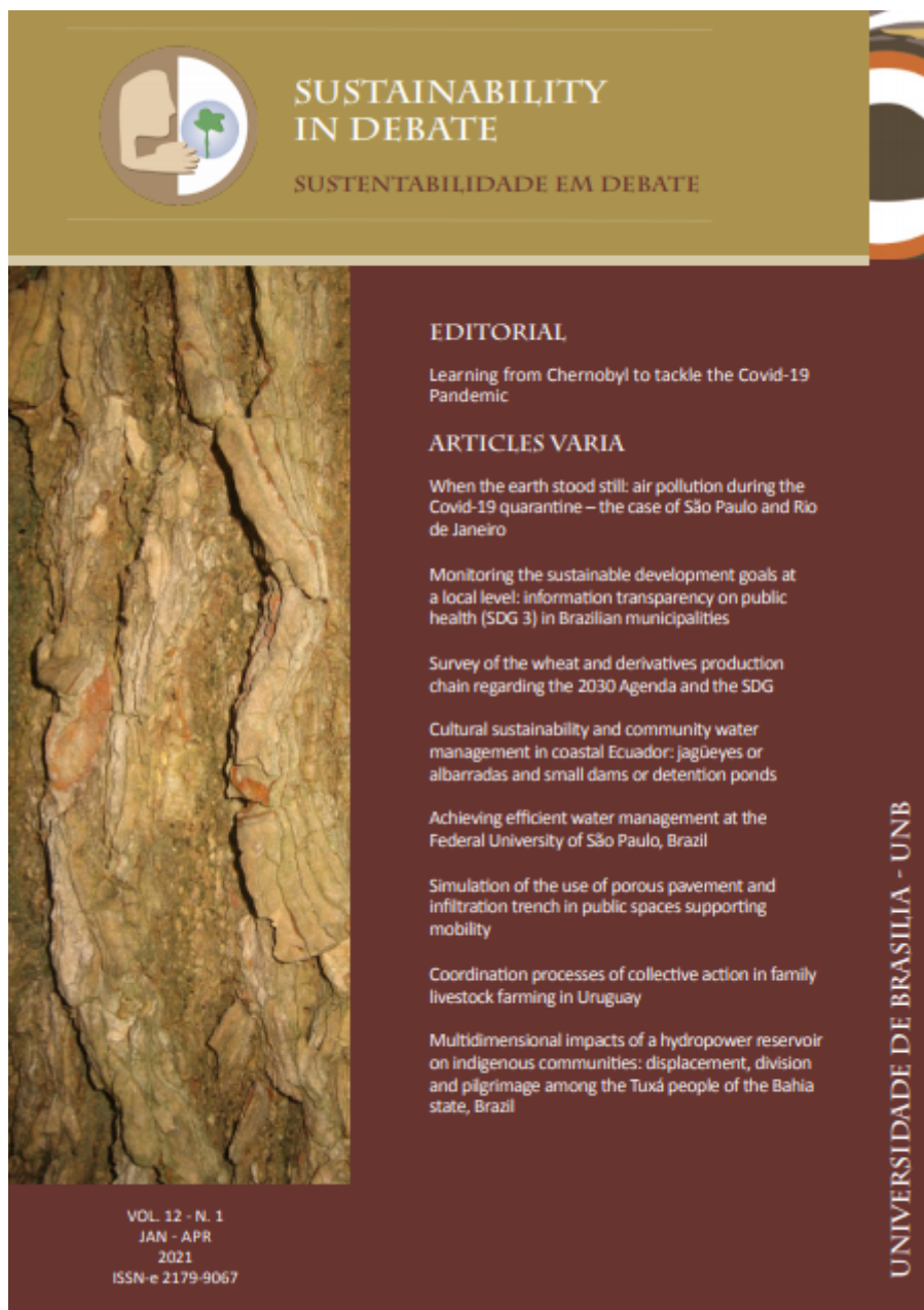
Foto: Capa da revista Sustentabilidade em Debate.