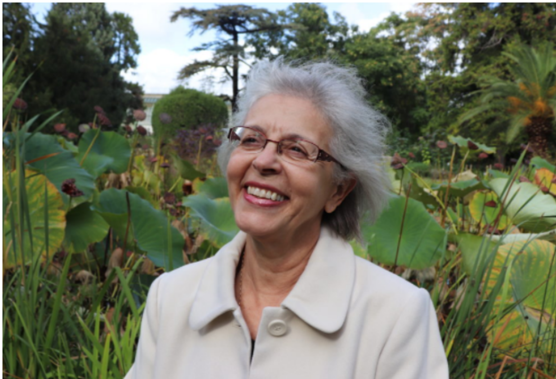
Abril, 2021.

Confira a homenagem no canal Instituto de Estudos Avançados da USP .