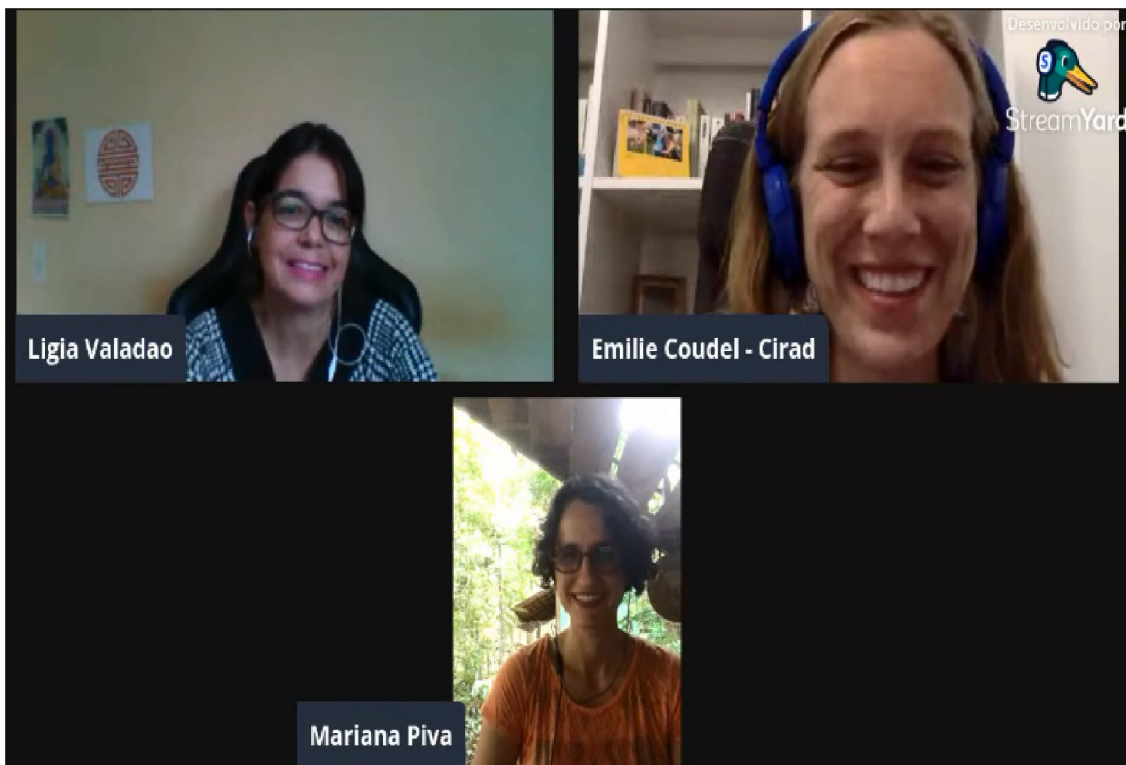
Captura de tela do evento "Ciência cidadã para avaliar o impacto da soja nos agricultores familiares da região de Santarém". Setembro, 2021.