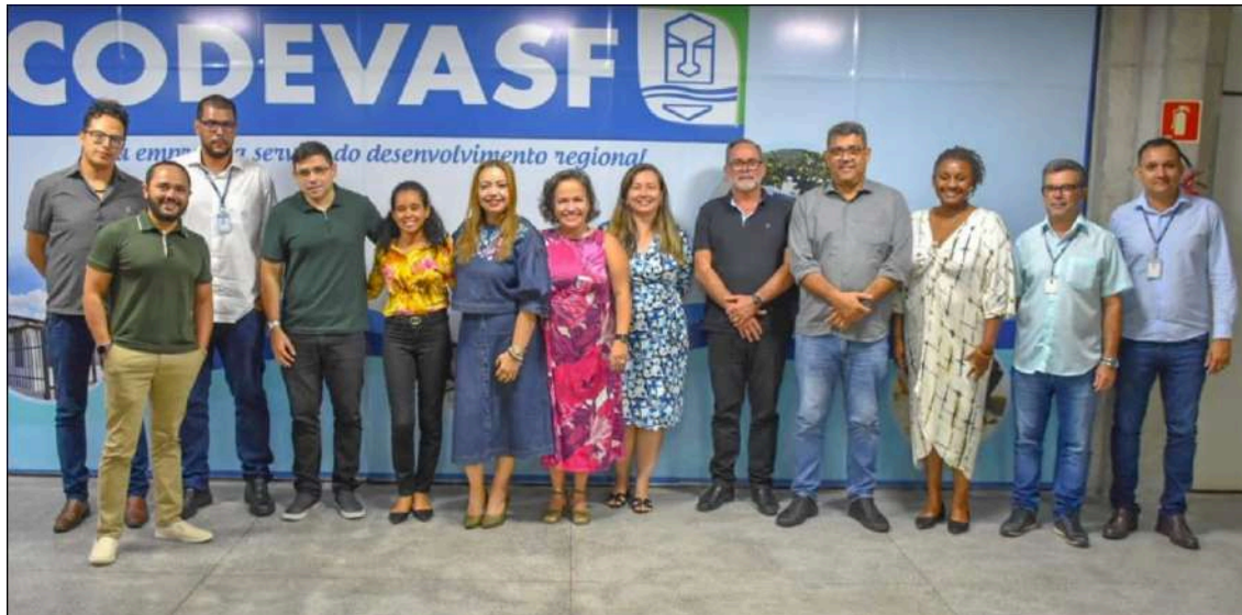
Imagem: Seminário Diálogos Institucionais: desafios e perspectivas de desenvolvimento sustentável em projetos de irrigação de interesse social. Arquivos INCT Odisseia. Maio, 2024.