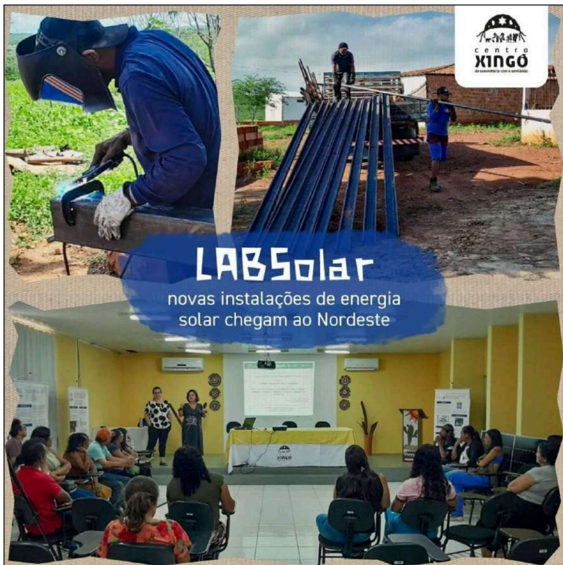
Imagem: Centro Xingó. Maio, 2024.