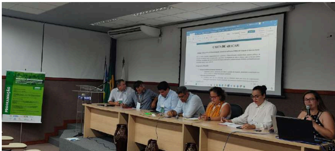
Imagem: Seminário Diálogos Institucionais: desafios e perspectivas de desenvolvimento sustentável em projetos de irrigação de interesse social. Maio, 2024.